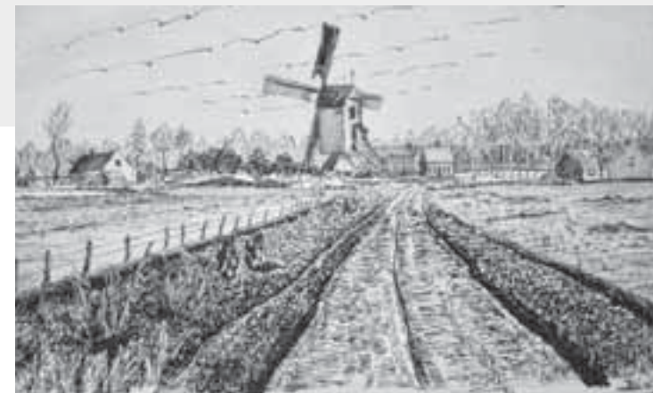
► Standaardmolen (1935)

Stichting Bernard van Dam (1881-1958) treft momenteel voorbereidingen om te gelegener tijd (in het post-coronatijdperk) een interessante middag of avond te verzorgen door middel van lezing/presentatie en eventueel discussie. De stichting denkt daarmee de deelnemers op een interessante manier met het werk van Bernard van Dam kennis te laten maken. Voor meer informatie: info@bernardvandam.com of mobiel nummer 06-26881588.