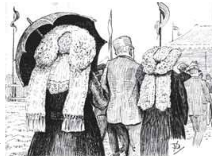
► Op z'n zondags naar het concours hippique (1929)