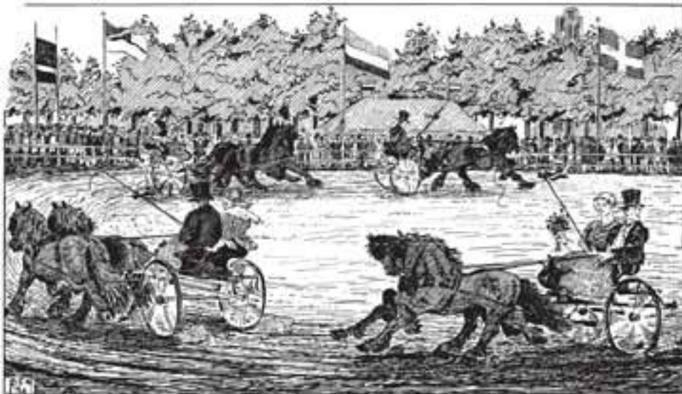
► Sjees rijden (1929)