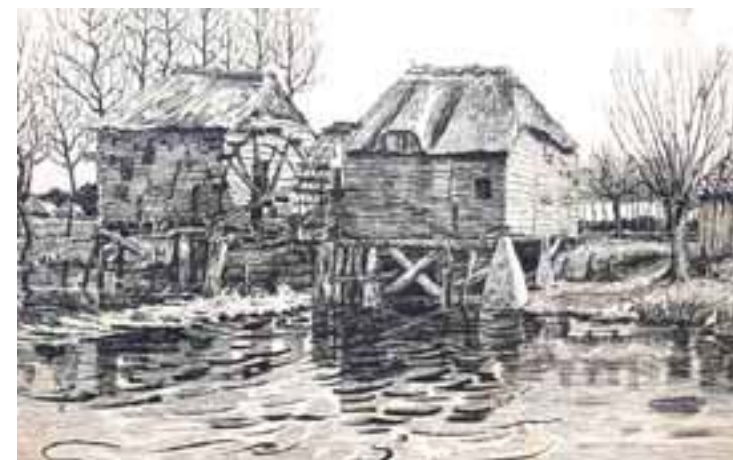
► Watermolen Wolfswinkel