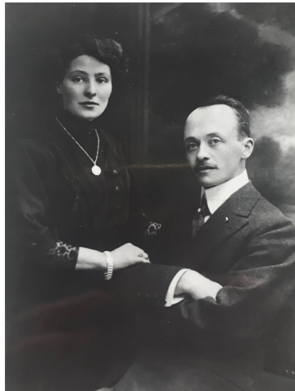
STICHTING BERNARD VAN DAM

Pas in 1995 wordt er een publiek geheim rond zijn persoon écht onthuld, waar het dorp tot die tijd alleen maar hardnekkige roddels over heeft gehoord. En dat heeft alles te maken met zijn huwelijk... Wat ooit een schandaal was.